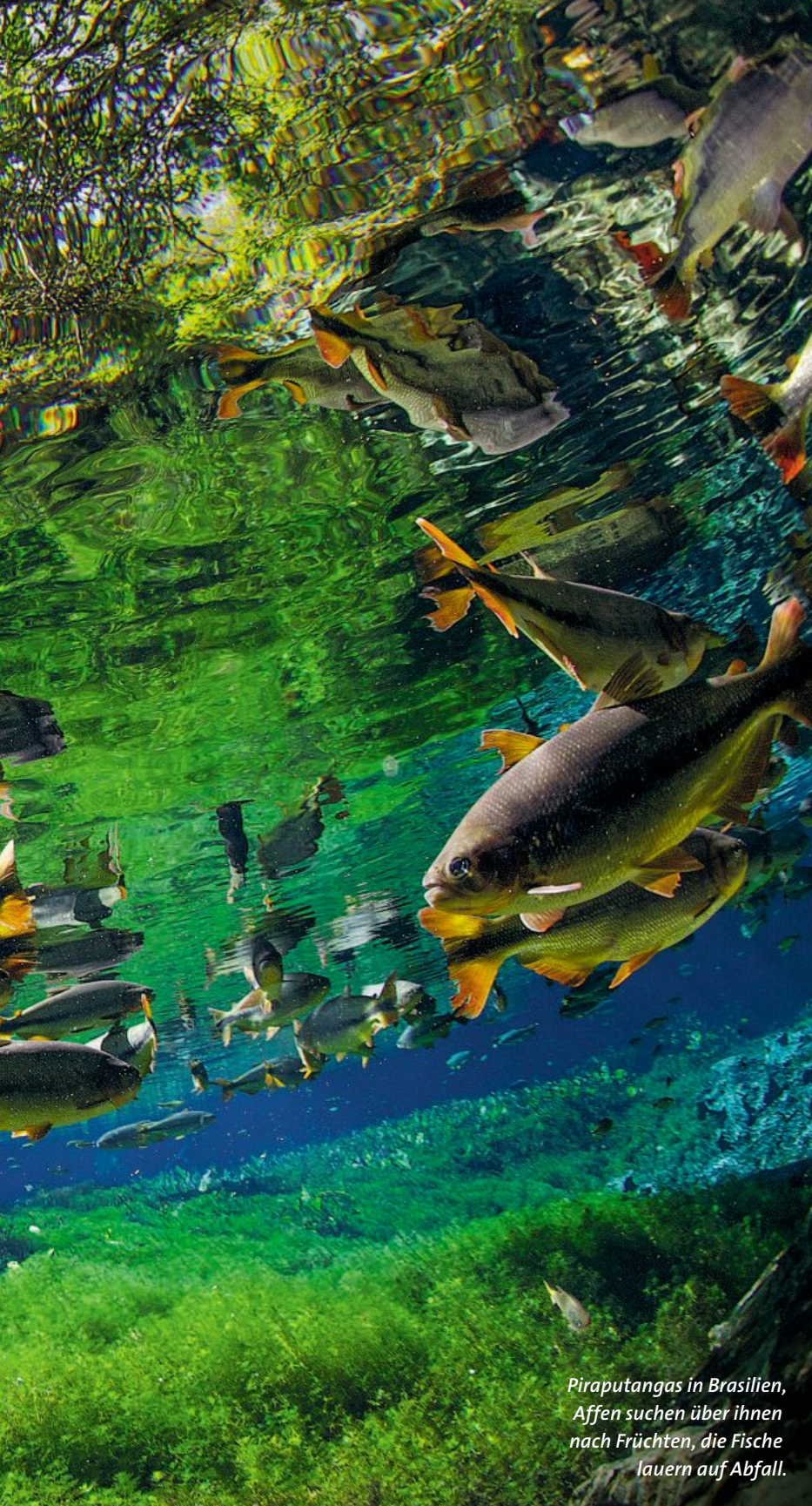
Piraputangas in Brasilien, Affen suchen über ihnen nach Früchten, die Fische lauern auf Abfall.